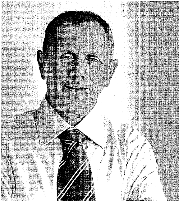
נוכח פליטה מהתקופה הקודמת

איך ניצלנו ממיתון ברבע השני של 2008? האם אנשים יפסיקו להשתמש בשער דולר דמיוני של 4.5 שקלים? וגם: במדינת ישראל צריכה לתמוך יותר: בזקנים או בילדים?